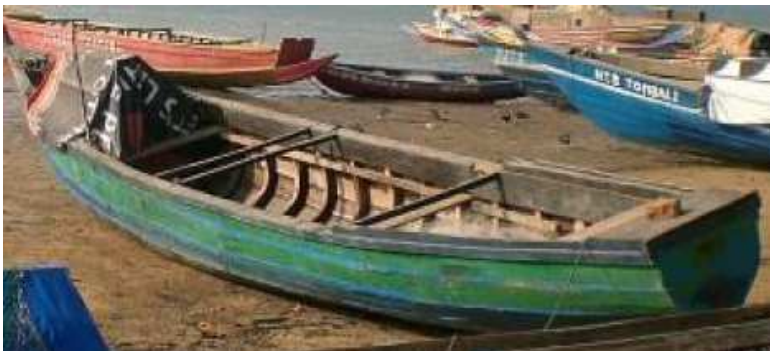
Pirogue à membrures (type Salan)