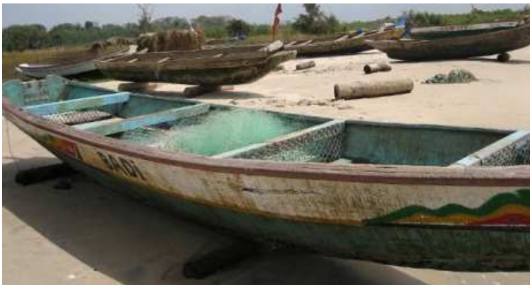
Pirogue en planche