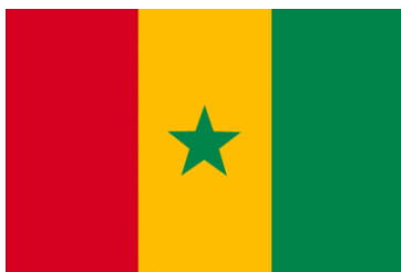
Direction Générale des Impôts et des Domaines (DGID)